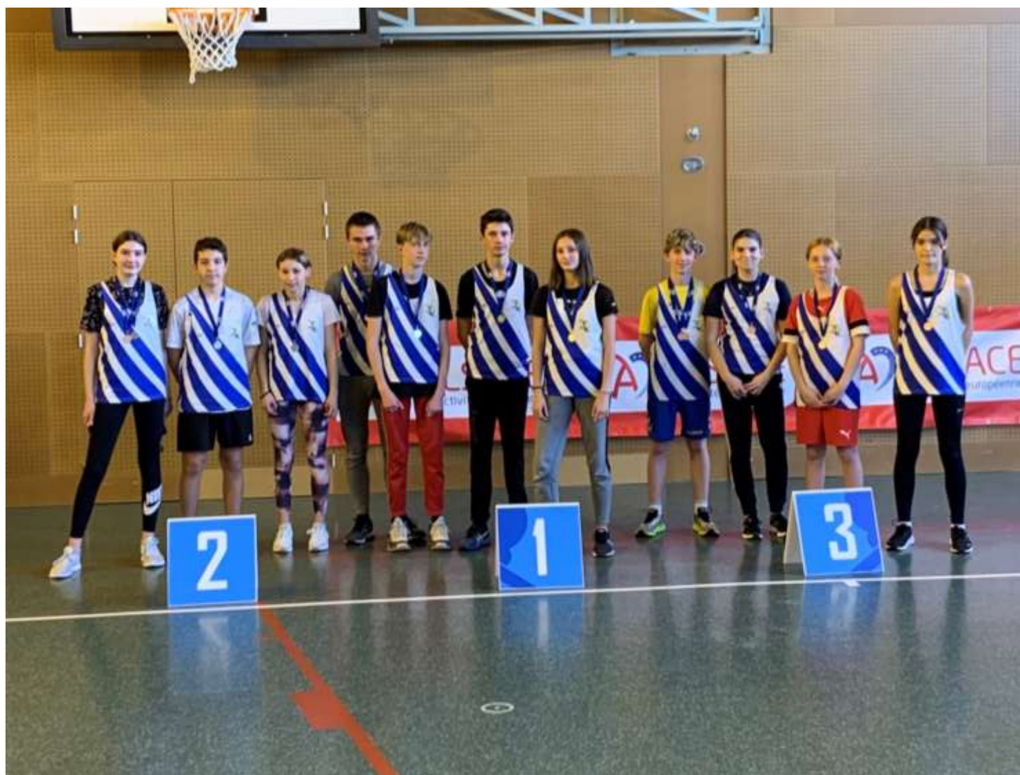
Les équipes en Sauts