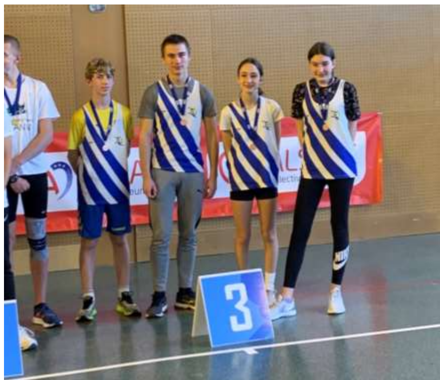
L'équipe en vitesse