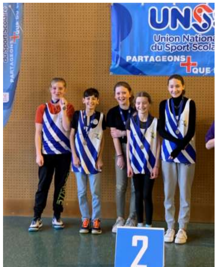
L'équipe en haies