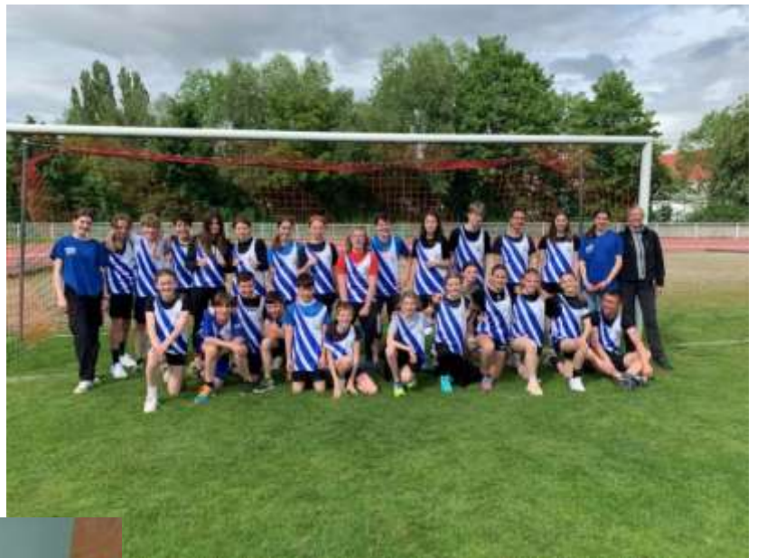
VICE -CHAMPION D'ACADEMIE BADMINTON MAI 2023