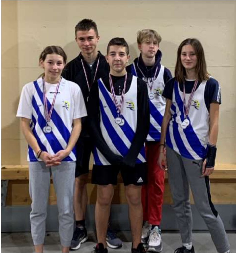
L'équipe en sauts