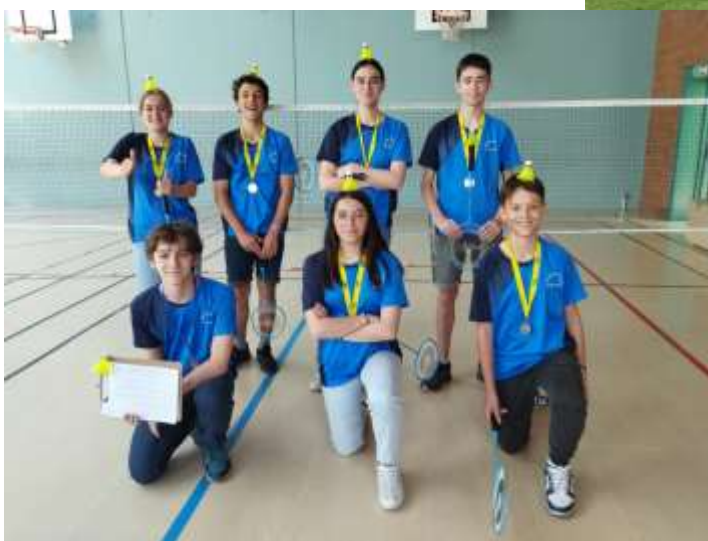
3 ème régional Volley JUN 2023