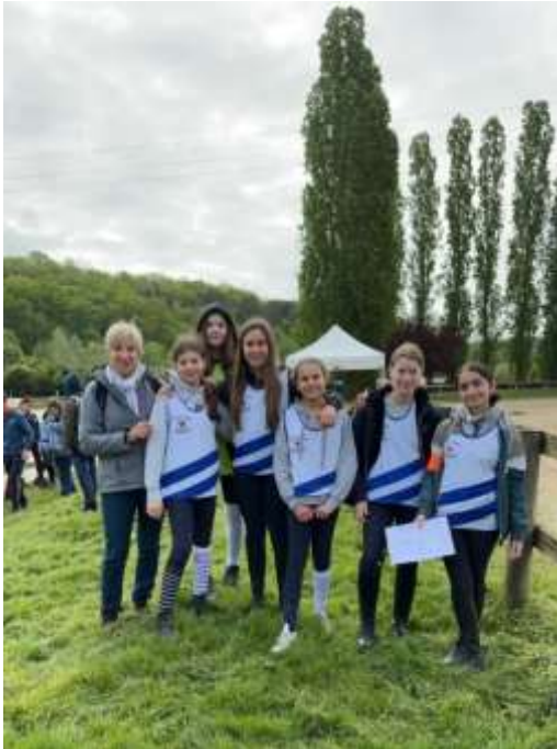
CHAMPIONNAT D'ACADEMIE D'ATHLETISME ESTIVAL MAI 2023