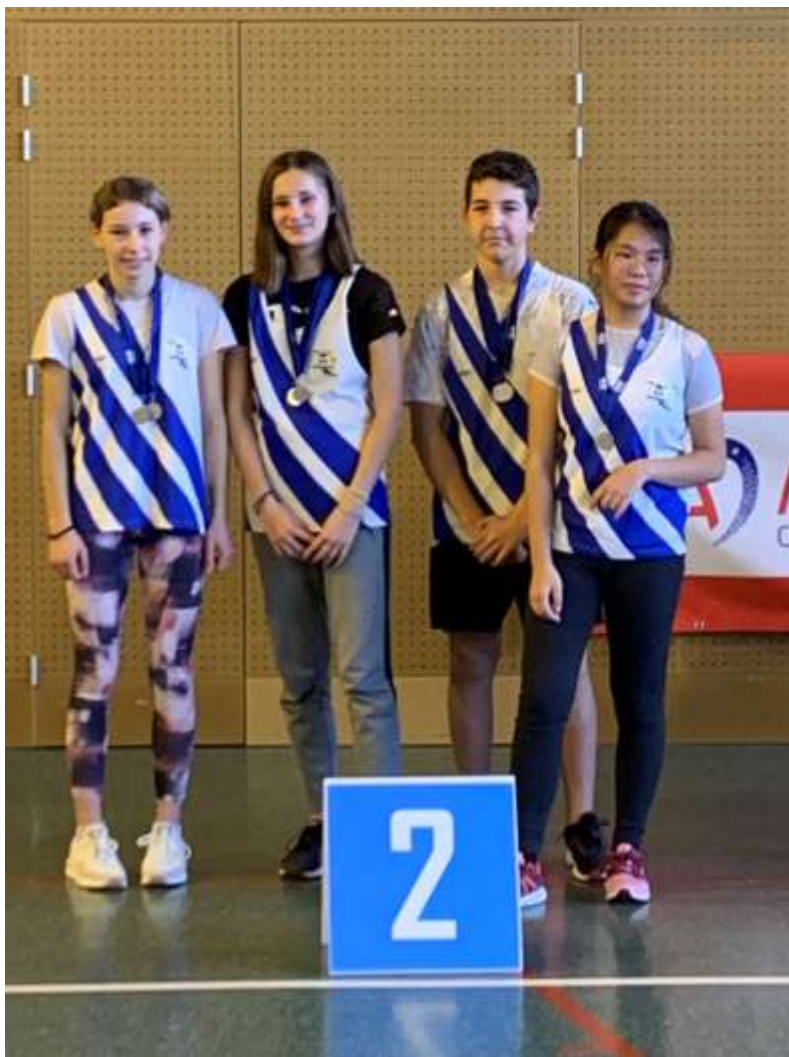
L'équipe en Haies