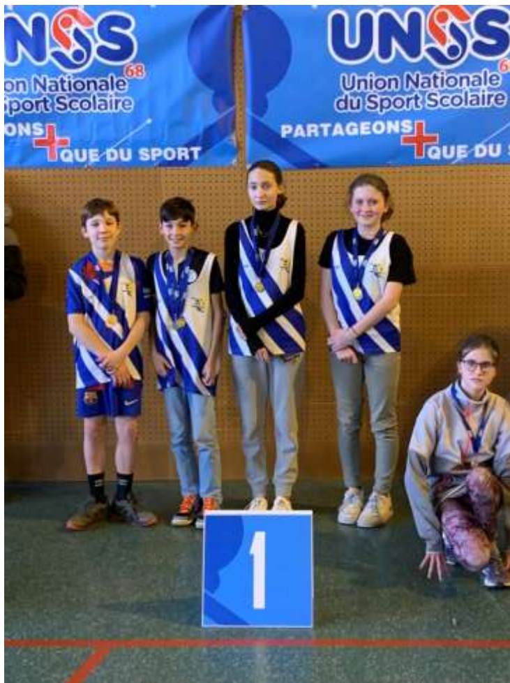
L'équipe en sauts