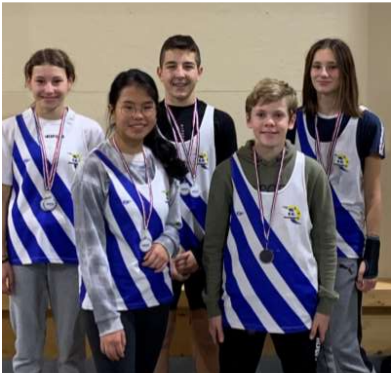
L'équipe en Haies